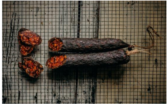
Marhás Szalámi 6900/kg

paprika nélküli változatban Apróra darált szalámifajta Egy rúd kb 600-700g