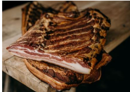
Kolozsvári szalonna 5500/kg

Füstölt hátsó csülök, kb. 2 kg. Egészben tudjuk küldeni.