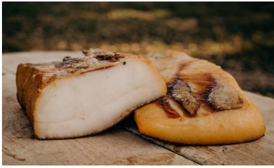
M. Szalonna 3500/kg

Vastag és lágy füstölt szalonna pörccnek, tűzdelni, nyársalni vagy kakastaréjnak. Pörkölt alapú ételek alapja