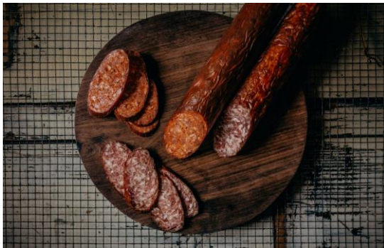
Sertés szalámi 9200/kg

paprika nélküli változatban Apróra darált szalámifajta Egy rúd kb 600-700g