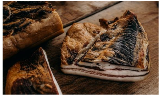
M. Császár 5800/kg

Vastag és lágy füstölt szalonna pörccnek, tűzdelni, nyársalni vagy kakastaréjnak. Pörkölt alapú ételek alapja